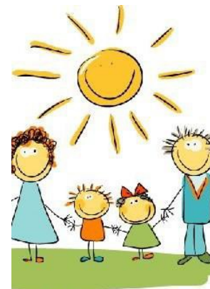
Las familias son los primeros educadores de sus hijos.